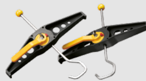
Leiterklemme für Dachträger