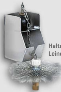
Halterung für Leinenbesen