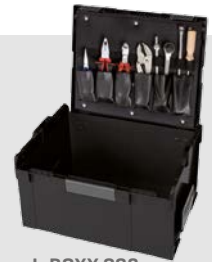
L-BOXX 238 inkl. Werkzeugkarte