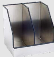
Ablagebox z.B. für Ordner A4