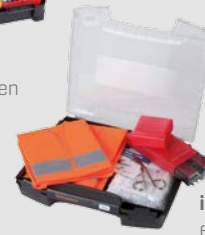
i-BOXX 72 CS ersetzt einen Standard-PKW-Verbandkasten