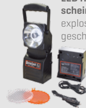
LED Hand-scheinwerfer explosions-geschützt