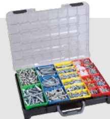
T-BOXX E3 inkl. Insetboxen