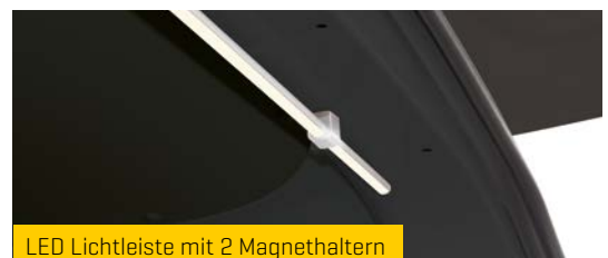
LED Lichtleiste mit 2 Magnethaltern

Ein idealer Platz für den Schwarz-Bereich. Sperrige Gerätschaften wie Kehrhaseln, Rußbeimer, Teleskop-Kratzer ... können komfortabel und ergonomisch günstig verstaut und gesichert werden. Optional lassen sich in der aufgesetzten Materialwanne weitere Unterteilungen oder Rückhaltesysteme anbringen.