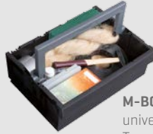
M-BOXX universell einsetzbarer Tragebehälter