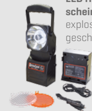
LED Hand- scheinwerfer explosions- geschützt