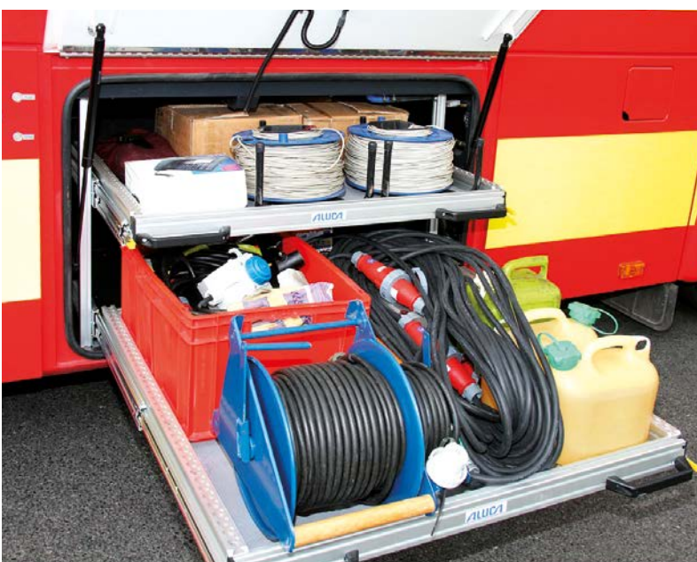
Schwerlastauszug mit Materialdepot