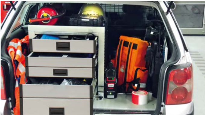
Ordnung für die PKW-Klasse