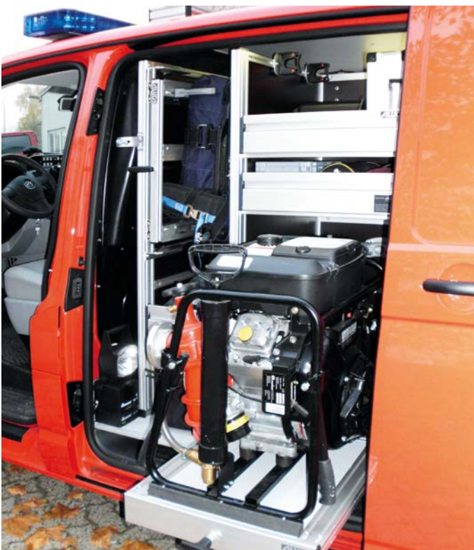
Individualausbau mit Schwerlastauszug