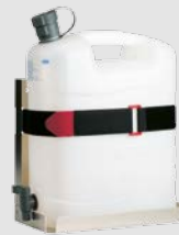
Kanister lebensmittelecht mit Ausgussahn und Wandhalterung