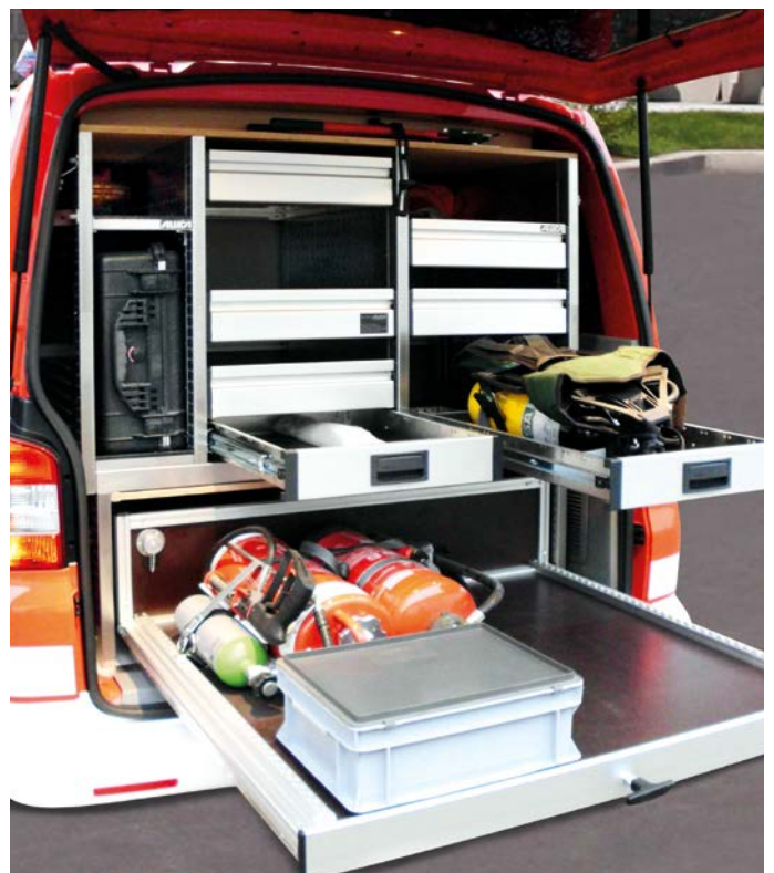
Großzügiges Materialdepot für Atemschutz und Löscher