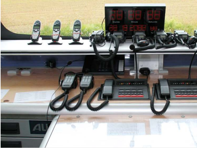
Kommunikationszentrale mit Telefon und Funkgeräten

Katastrophenschutzbus - Mobile Einsatzleitzentrale Kreisfeuerwehr Northeim