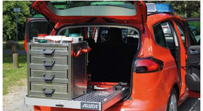
Heckauszug für PKW-Kombis