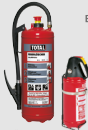
Feuerlöscher mit Halterung