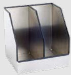
Ablagebox z.B. für Ordner und Dokumente