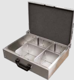
Aluminiumkoffer hoch inkl. Trenn- und Steckwände