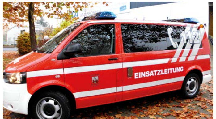
Folierung und Kennzeichnung