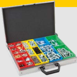
Aluminiumkoffer niedrig inkl. Insetboxen