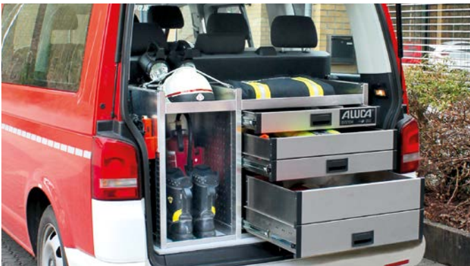
Kompakter Heckausbau für Mannschaftstransportwagen