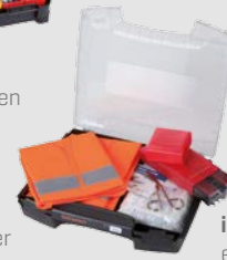
i-BOXX 72 CS ersetzt einen Standard- PKW-Verbandkasten