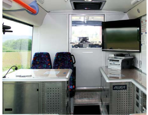
Installation mobiler Bürolösungen und diverser Gruppenarbeitsplätze.

- Antworten auf ihre Fragen - Vereinbaren Sie ihren Beratungstermin: blaulicht@aluca.de